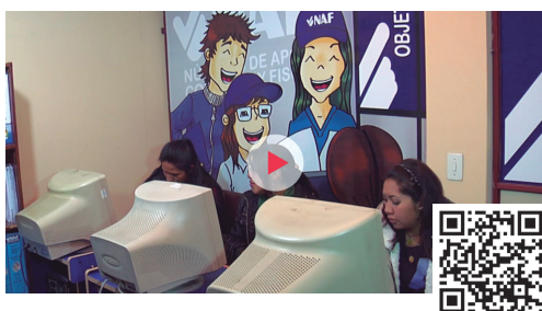
Vídeo Educación Fiscal y Cohesión Social