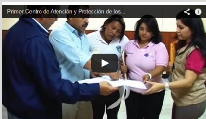
Primer Centro de Atención y Protección de los Derechos de las Mujeres en Honduras