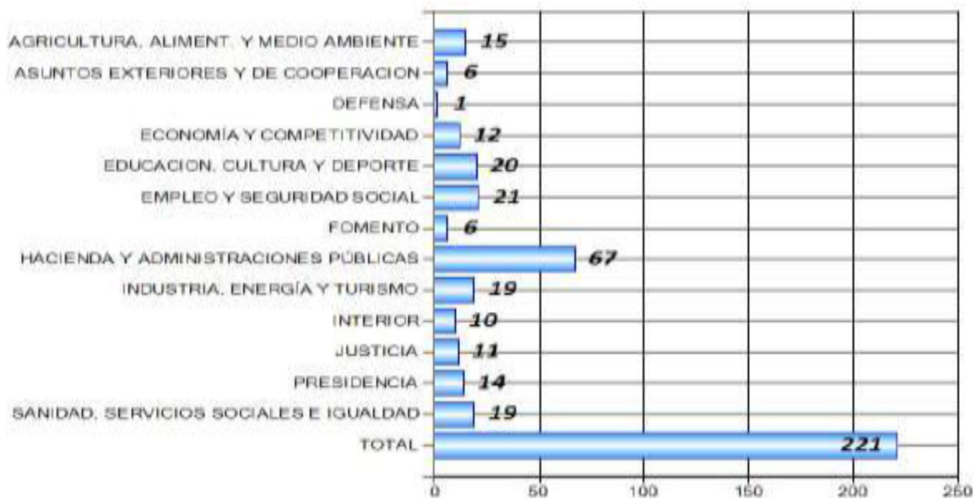
Número de Medidas Propuestas: MINISTERIOS, Marzo 2014