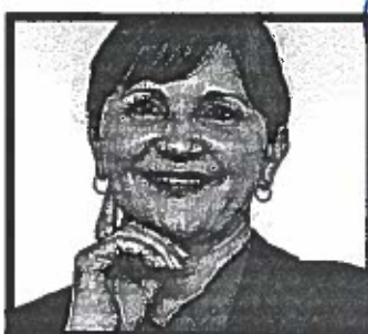
Gloria Porras Presidenta de la Corte de Constitucionalidad 54 años

Combatiente durante la guerra, suscriptor de los Acuerdos de Paz, primer presidente de formación militar en muchos años y gobernante de una administración que hoy tambalea. Pérez Molina ha vivido los grandes momentos históricos modernos del país, pero toda su experiencia política ha sido insuficiente para impedir que su gobierno sea hoy considerado el más corrupto y en muchos sentidos fallido de la era democrática.