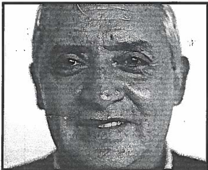
Otto Pérez Molina Presidente de Guatemala 64 años

En el mundo empresarial es visto como el cerebro detrás de la creación del grupo más grande y exitoso del país. Ya eso le convierte en una voz a la que muchos escuchan. Pero este ingeniero agrónomo, formado en España, es también autor prolífico (ha publicado una veintena de libros) y es el responsable de la modernización de la prensa guatemalteca. Como creador de la Revista Crónica (de los años ochenta) y como difusor del pensamiento liberal, tiene renombre y peso. En el mundo de las letras su voz es tanto más respetada y en el del periodismo, el gremio le considera uno de sus grandes maestros.