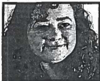
Claudia Paz y Paz Ex fiscal general 48 años

A su paso por el Ministerio Público reorganizó la institución, redujo los índices de impunidad y fortaleció la persecución por crímenes de derechos humanos, un mérito que también le impidió competir por la reelección y la movió a dejar el país. Ha sido reconocida, más a nivel internacional que local, como una de las mujeres más relevantes en la lucha por la justicia de transición. Actualmente, integra el equipo técnico que busca a los 43 estudiantes desaparecidos de Ayotzinapa, México.