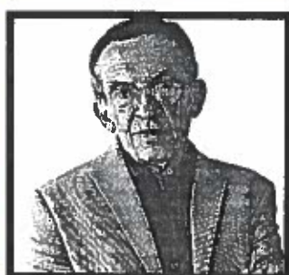
Gustavo Porras Presidente del Consejo Económico y Social 68 años

Es la magistrada más joven entre los titulares de la Corte de Constitucionalidad y la única mujer, además. Fue nombrada por la pareja presidencial formada por Álvaro Colom y Sandra Torres, tras una labor ejemplar en el Ministerio Público. Sin embargo, tenerla en el estrado no ayudó a Torres a ser inscrita como candidata presidencial. Ahora, en su último año, la jueza rebelde dirige la corte más importante del país. Es la magistrada que más votos razonados ha emitido.